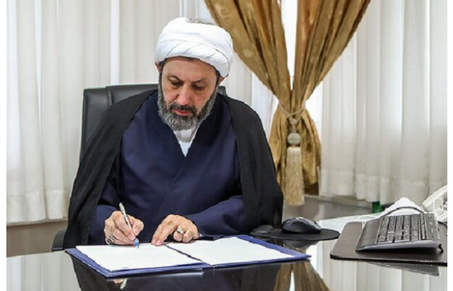
الشيخ الدكتور محمد مهدي إيماني بور- رئيس منظمة الثقافة والعلاقات الإسلامية

الإنسانية العالمية العظيمة والحركة الدولية المناهضة للصهيونية، ارتكب المستعمرون والمستغلون العالميون جريمةً شنيعةً في ٢٨/شباط ٢٠٢٦ م . حيث قامت أمريكا والكيان الصهيوني بقصف مكتب آية الله العظمى السيد علي الخامنئي في طهران، مما أدى إلى استشهاد هذا القائد العظيم، وذلك بهدف تمهيد الطريق لتغيير النظام وتفكيك إيران وتجزئتها. إلا أن الشعب الإيراني العظيم، بالاعتماد على حضارته العريقة في جذور التاريخ، وعمق فكره العلوي والحسيني والمهدي، صنع من هذه الكارثة ملحمة خالدة.. فهذا الشعب بانتفاضته الواعية، أستولى على زمام المبادرة، وحول مؤامرة العدو إلى عاملٍ لتعزيز الوحدة والمقاومة والتقدم والتوجه الصارم نحو الهجوم الدفاعي . وفي ظل ظروف أمنية بالغة الصعوبة، وموجة الإغتيالات والحرب، و من خلال تشكيل مجلس الخبراء ومشاركة ممثلين منتخبين من الشعب، وفي إطار الدستور والشريعة الإسلامية، اكتملت عملية اختيار خليفة القائد الشهيد، وتولى آية الله السيد مجتبي الحسيني الخامنئي -حفظه الله من شرور هذا الزمان- القيادة الجديدة. وهو فقيه، وعالم، وشخصية مرموقة، وقيادية، وإدارية، وشخصية دولية، يُعد انتخابه بمثابة ضربة قاضية لقتلة القائد الشهيد، ومصدر أمل وفخر للشعب الإيراني ولكل الأحرار في العالم. والتأييد والولاء الواسع للشعب والنخب لهذا الاختيار جعل هذا الاختيار أكثر بركةً ونجاحاً وأملًا. وكلنا أمل في العون الإلهي والتوفيق المتزايد له.